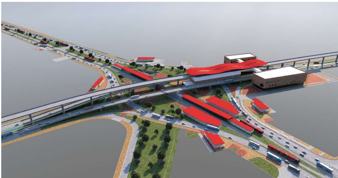
Imagen: Render Intersección Estación Primero de Mayo. 03 de noviembre de 2025

Te invitamos a hacer uso del formulario de Radicación Web